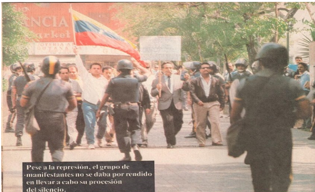
Pese a la represión, el grupo de manifestantes no se daba por rendido en llevar a cabo su procesión del silencio.

UN PUEBLO REBELDE QUE GRITO EN LA CALLE: YA BASTA CARAJOO!!! UN PUEBLO INDÓMITO QUE PROTAGONIZÓ LA HISTÓRICA PRIMERA REBELIÓN CONTRA LA IMPOSICIÓN DEL NEOLIBERALISMO COLONIALISTA, PARA EJEMPLO DE LA LUCHA POPULAR, ANTE EL MUNDO Y AHORA CON EL CONDUCTOR DE VICTORIAS NICOLÁS MADURO, SEGUIREMOS VENCENDO